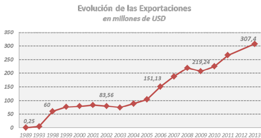
Gráfico 2. Evolución de las exportaciones TI

En cuanto al Ranking de los 5 Principales Destinos de Exportación de las empresas socias de Cuti, el mismo continúa siendo liderado por los Estados Unidos, que incluso ha aumentado su peso relativo como destino de exportación, y Brasil que también mantiene la segunda posición, aunque con un peso relativo inferior al exhibido durante el año 2011. México sube a la tercera posición desplazando a Chile respecto a la situación del año 2011. En la siguiente tabla se puede apreciar además del peso relativo de cada mercado, el desplazamiento que ha tenido respecto a la situación del año 2011.