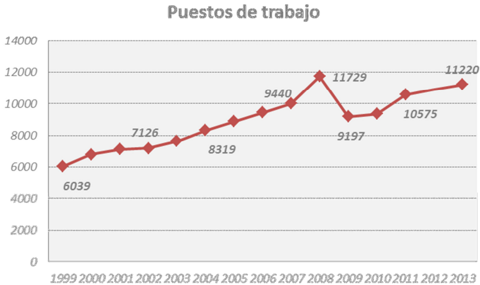
Gráfico 5. Evolución empleo generado por las empresas socias de Cuti

Analizando el empleo generado por la actividad principal que desarrollan las empresas socias de Cuti, el segmento Servicios TI es el que mayor proporción de empleo genera (62%). Este resultado es esperable dado que las empresas orientadas a la comercialización de servicios tecnológicos son más intensivas en empleo que las de Producto.